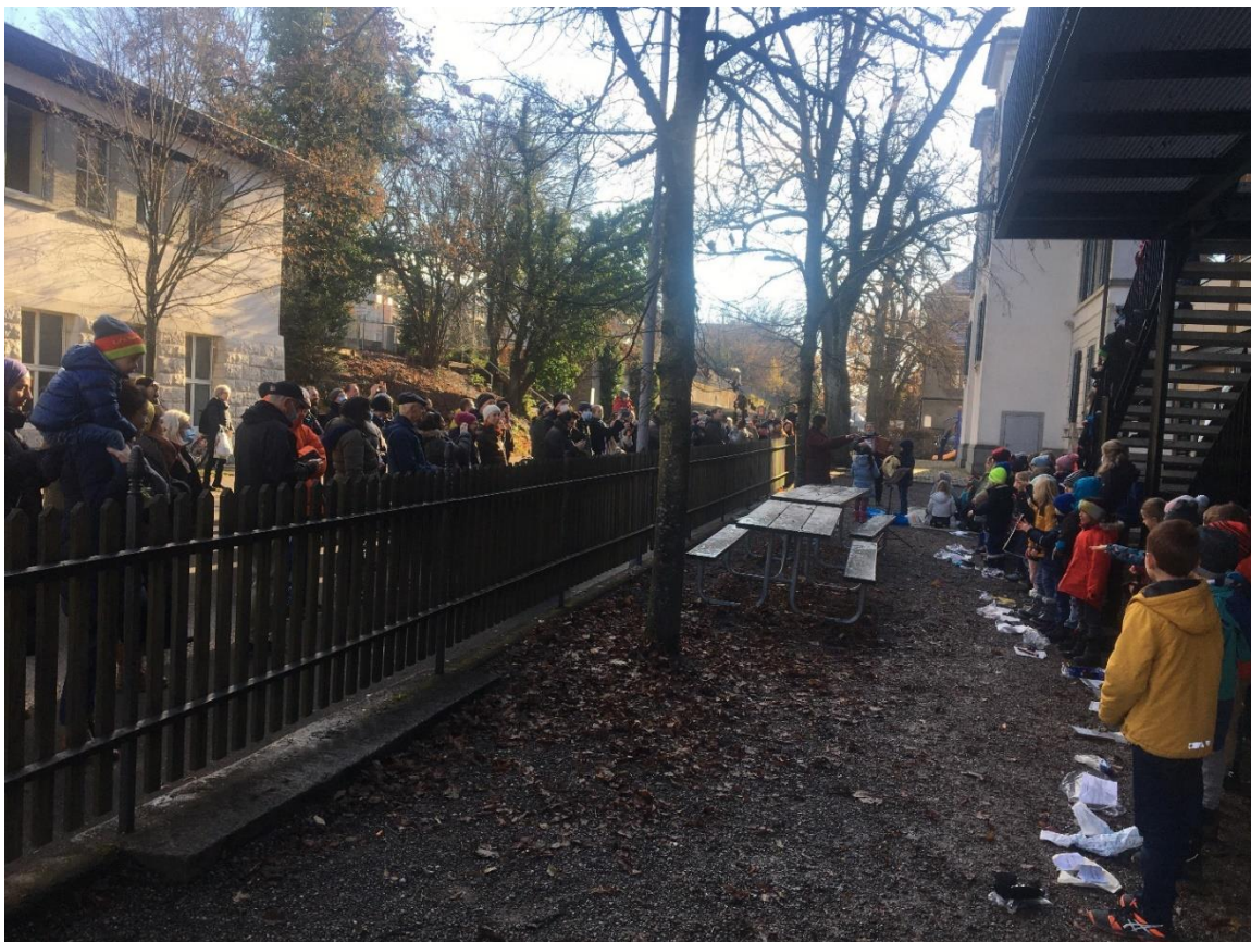
Weihnachtssingen 2. Klassen vor dem Turnerpavillon