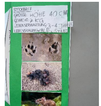
Lapbook-Eintrag zum Fuchs

Um den Einstieg ins Thema Walddiere möglichst anregend zu gestalten hatten wir eine Führung im zoologischen Museum zum Thema einheimische Walddiere. Die Kinder konnten im Museum einen ersten Einblick in die Tierwelt gewinnen und einige Informationen aufnehmen. Viele Schülerinnen und Schüler zeigen ein grosses Interesse an Tieren und ihrer Lebensweise. Die Kinder haben sich im Schulzimmer das Wissen grösstenteils mit Hilfe von kurzen Sach- oder Hörtexten angeeignet und schliesslich ihr Wissen kompakt in einem Lapbook-Eintrag festgehalten.