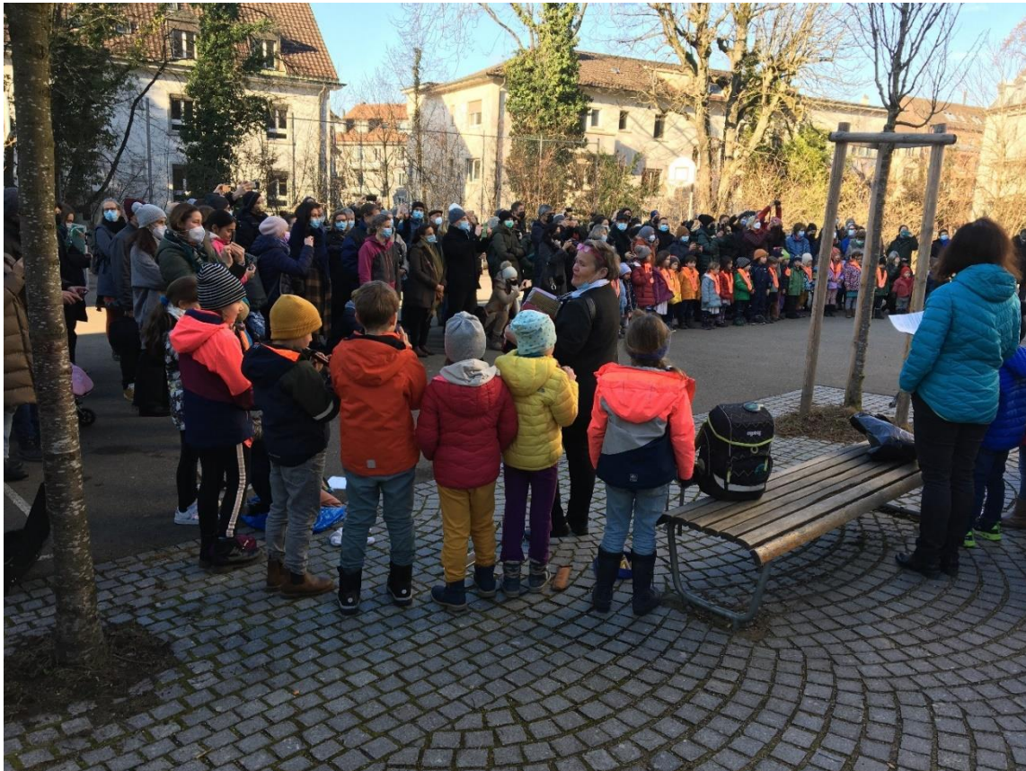
Weihnachtssingen 1. & 3. Klassen auf dem Pausenplatz Schulhaus Weinberg